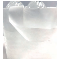
▲パルピース袋に商品を入れた際のイメージ画像

紙を粉砕し、粉状に細かくした紙パウダーと植物由来原料を配合した新商品「パルピース(Pulpeace)」。 プラスチック使用量を削減し、紙袋とポリ袋のいいとこどり!